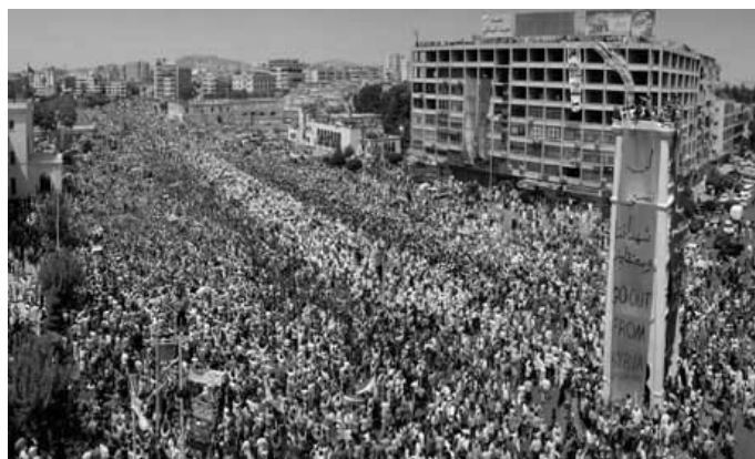
“Go out from Syria”: manifestazione ad Hama, luglio 2011

avuto decine, se non centinaia, di suoi militanti chiusi nelle carceri siriane per lunghi periodi. Il suo ritratto dei primi mesi della sollevazione, è il seguente: “La rivolta non si è ancora estesa a tutto il paese e a tutta la società. [...] I protagonisti della rivolta sono stati finora i giovani istruiti e quelli disoccupati in cerca di accesso alla modernità. I lavoratori industriali vi partecipano a livello individuale, molte delle persone che scendono in strada vengono da quello che io chiamerei ‘sotto-proletariato’: disoccupati, cittadini senza un lavoro regolare, che campano alla giornata . Essi lavorano precariamente, un paio di giorni qui un paio di giorni là, soprattutto fornendo servizi ai borghesi, come camerieri, facchini, portieri, etc. Non hanno alcuna sicurezza sociale o altri benefici [non si tratta quindi di sotto-proletari, bensì di proletari ‘di riserva’ , ossia dei proletari più precari –n.]. L’altra componente di questo movimento proviene dalla classe medio-bassa, soprattutto giovani laureati disoccupati . Circa il 20%