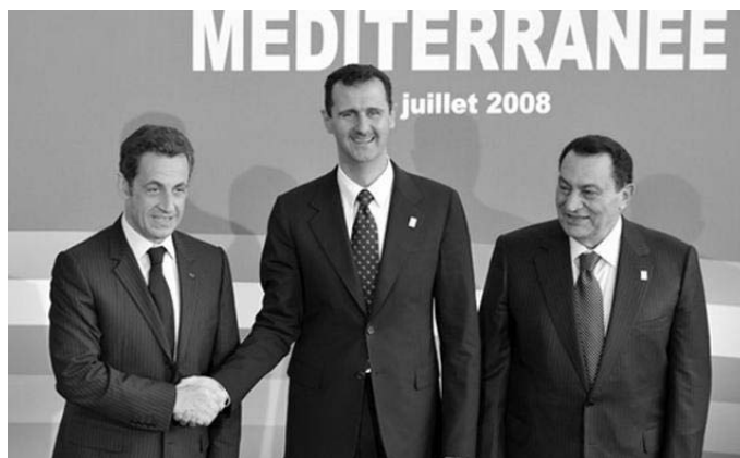
Sarkozy, Bashar al-Assad e Mubarak: bei tempi!

Per comprendere l'ampiezza e la composizione di classe dello scontento generato da tale contro-riforma,