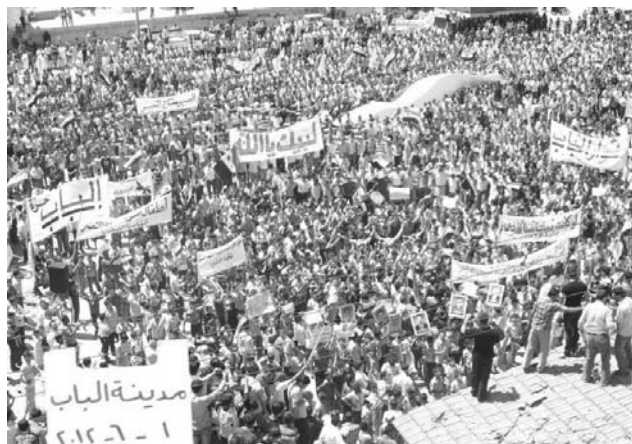
Aleppo, 1° giugno 2012: manifestazione anti-governativa

Non mancano però i punti di debolezza, anche molto pericolosi, perché espongono il movimento alle azioni divisive e diversive dei gruppi interni legati al CNS e