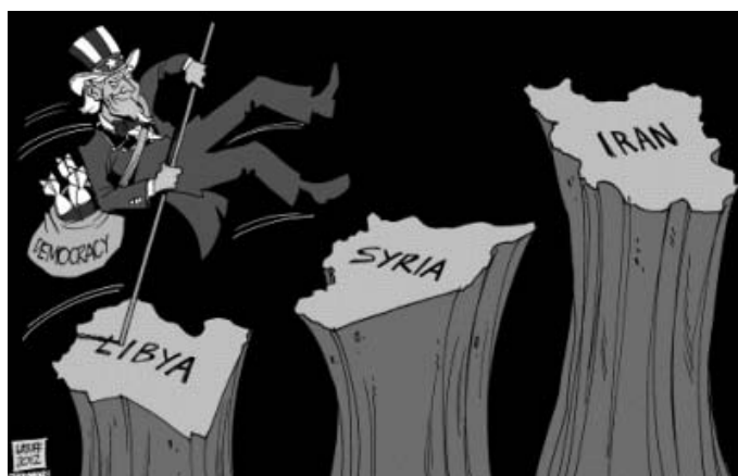
Il sogno delle potenze imperialiste

di ci terremo alla larga; la meno potente, ma non priva di efficacia, specie nell'estrema sinistra italiana da sempre pressoché totalmente dominata da attitudini staliniste, è la versione che il governo di Damasco dà del movimento popolare di rivolta in corso, schernito come un'accozzaglia di afgani, palestinesi, jihadisti, barbuti, terroristi, banditi, o demonizzato come il prodotto di una cospirazione straniera. E tuttavia, pur con i limiti del caso, una ricostruzione attendibile degli avvenimenti secondo il metodo marxista è, per chi sia realmente intenzionato a farla, tutt'altro che impossibile. Noi l'abbiamo compiuta ricorrendo a molteplici fonti di quella parte della opposizione ad Assad che è