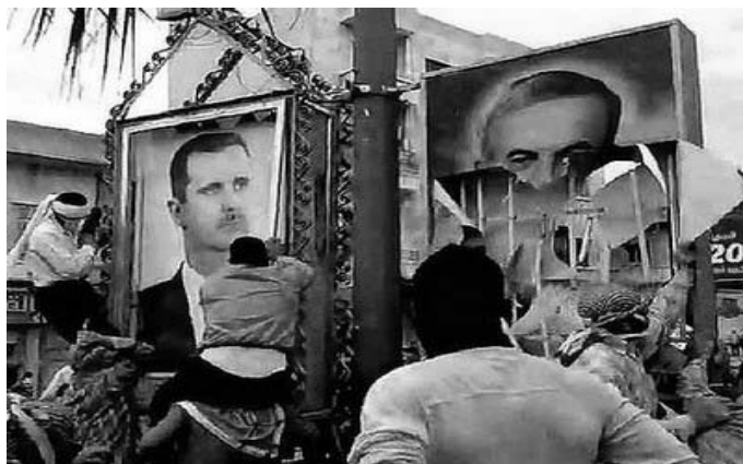
I manifestanti strappano i ritratti di Bashar e Hafez al-Assad

Un altro persistente punto di forza del regime di Bashar è il sostegno delle gerarchie religiose cristiane e cattoliche e, su scala più ampia, della maggioranza dei cittadini di fede cristiana, nonché della popolazione alawita, settori nei quali non solo la propaganda di stato, ma anche la virulenza di alcune tendenze particolarmente settarie e retrograde dell'islamismo suscita una ben comprensibile reazione di paura. “Dopo di me, dieci Afghanistan”, ha affermato Bashar, centrando in pieno con questo slogan il bersaglio, e proponendosi come il solo in grado di proteggere quell'unità nazionale che tanto sta a cuore ai siriani dalle minacce settarie interne e dall'aggressione esterna. La paura del caos, di un nuovo Libano e di una nuova Libia, è stata cavalcata dal governo di Damasco con sicura pe-