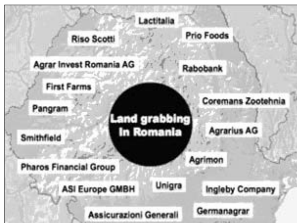
Le aziende estere protagoniste del land grabbing in Romania

In tutta l'Europa orientale la concentrazione della proprietà fondiaria ha registrato un'accelerazione dopo che questi paesi sono entrati nell'Unione Europea, a partire dal 2004. La loro popolazione è stata costretta a svendere le proprie terre alle multinazionali occidentali per cercare di fronteggiare il progressivo impoverimento a cui è stata avviata dai vincoli imposti dall'Ue e dalle politiche iper-liberiste adottate dai propri governi nazionali. Molti agricoltori, infatti, sono andati in bancarotta quando i prodotti agricoli dell'Ue, altamente sovvenzionati, hanno inondato i mercati dei loro paesi. A ciò si aggiunge che, per i primi sei anni, la maggior parte dei piccoli agricoltori dell'Est non ebbe nemmeno la possibilità di fare domanda per ricevere le sovvenzioni agricole comunitarie: un veto, questo,