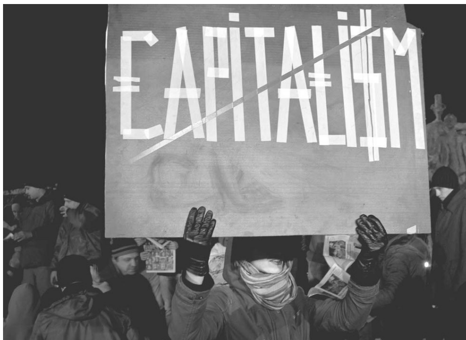
Manifestazione in Romania

dotti chimici per l'edilizia), la Merloni e la Iveco, che ha rilevato la storica fabbrica produttrice di autobus per l'intero blocco sovietico. L'Italia è ben radicata nel Paese anche nei settori delle macchine agricole 37 e delle macchine per il confezionamento e l'imballaggio dei prodotti alimentari. Le Generali hanno una presenza importante sul mercato assicurativo, mentre Intesa-Bci è tra le banche leader sul mercato ungherese. Insomma, i "nostri" capitalisti e finanzieri si ingrassano a più non posso di lavoro ungherese non pagato.