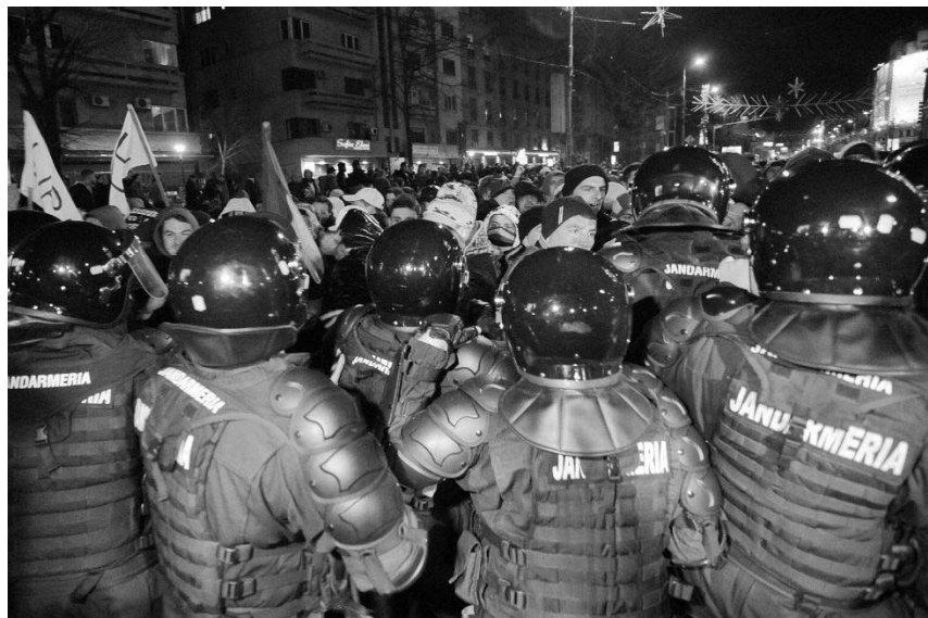
Manifestazione in Romania